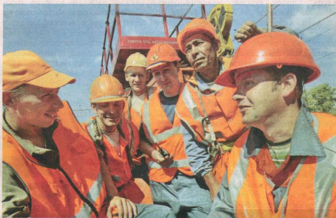
Энергетики оборудовали на станции новую контактную подвеску